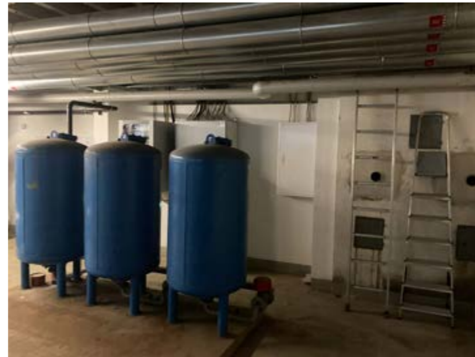
Untergeschoss / Heizraum